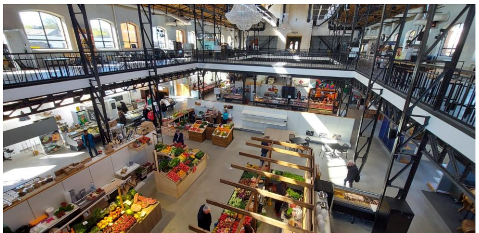
Fig 1 and 2: Āgenskalns food hub